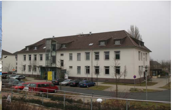
FiDT Technik & Natur (Haus Nr. 4)