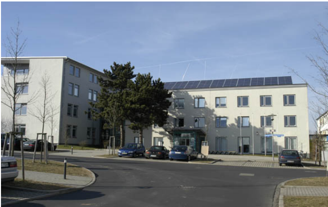
FiDT Haupteingang – Sekretariat (Haus Nr. 10)

Die Firma Technik & Natur befindet sich in der Ludwig-Erhard-Straße 4 in 34131 Kassel. Sie ist im FiDT-Technologie- und Gründerzentrum, gegenüber dem TEGUT-Markt auf dem ehemaligen Kasernengelände Marbachshöhe im Stadtteil Kassel Wilhelmshöhe zu finden. Die Büros befinden sich im Haus 4 im Erdgeschoss. Die Seminarräume je nach Bedarf in den Häusern 8, 10 oder 12, bitte achten Sie auf die Angabe in der Teilnahmebestätigung, sowie auf die Hinweise im Hauptgebäude. Klingeln Sie direkt am Haus 4 oder melden Sie sich am Haupteingang (Sekretariat) im Haus Nr. 10, das Haus mit der Solaranlage und den Antennen auf dem Dach, an.